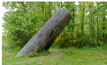
Alain Di Gallo