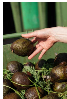
Caroline Krajcir, GRADwanderung, Foodwasteland, BelleVue, 2024