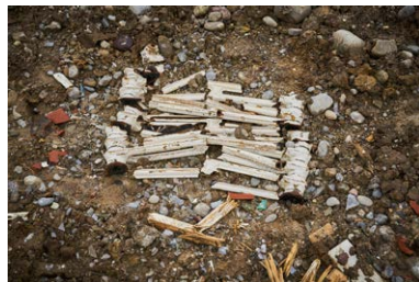
Saskja Rosset, GRADwanderung, BelleVue, 2024