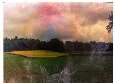
Rahel Zuber, GRADwanderung, Nährstoffkonzentration, BelleVue, 2024