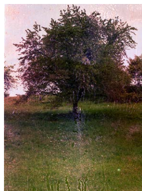
Rahel Zuber, GRADwanderung, Nährstoffkonzentration, BelleVue, 2024