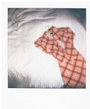
Sabina Bobst, GRADwanderung, Das Klima, die Angst und ich, BelleVue, 2024

https://bellevue-fotografie.ch/ausstellung/presse-lunax/