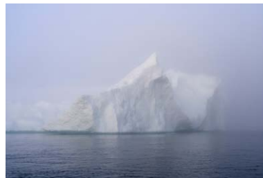
Fridolin Walcher, GRADwanderung, Hast du jemals einen Eisberg im Nebel gesehen?, BelleVue 2024