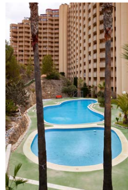
Annette Boutellier, GRADwanderung, Betonierte Sehnsucht, BelleVue, 2024