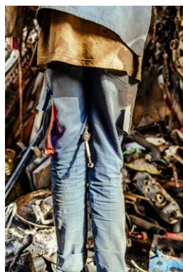
Mattia Coda, GRADwanderung, Vita ex machina, BelleVue, 2024