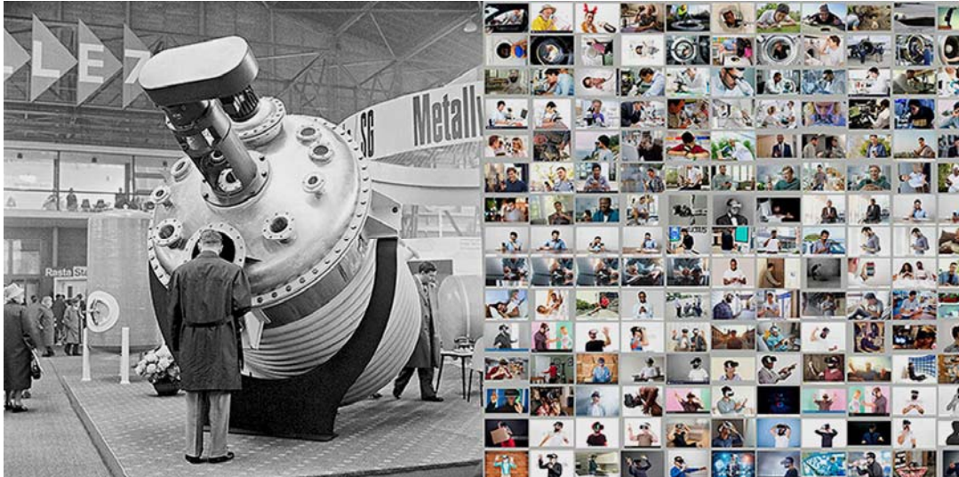
Ein Besucher besichtigt an der Schweizer Mustermesse von 1961 einen Chemie-Reaktor (Bild links von Hans Bertolf) in Kombination mit dem Bilderteppich von Thi My Lien Nguyen und Simon Tanner.