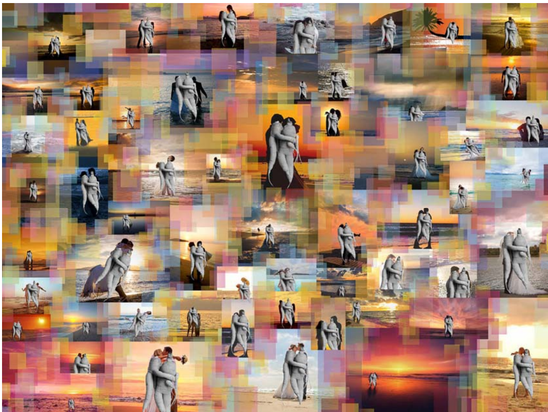
Das Bild «Rüebli [Les deux frères]» (1969) von Hans Bertolf setzen © Thi My Lien Nguyen und Simon Tanner mithilfe der digitalen Collagetechnik in einen zeitgenössischen Kontext und kreieren dadurch eine neue Sinndeutung der ausgewählten Archivbilder. Diese Collage «Rorschach» ist im Innenhof des Staatsarchivs Basel-Stadt zu sehen.