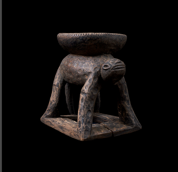
© Marion Bernet «Hier und dort»